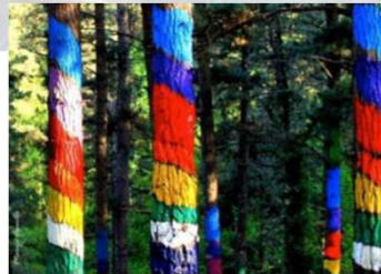
El hogar de cinco sitios diferentes declarados patrimonio de la humanidad