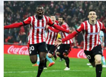
Deporte, gastronomía, floclore, festivales...