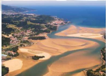
La playa a 10 minutos del centro de la ciudad